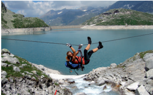
Kühner Beginn: die Einseil-Brücke