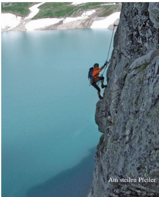
Am steilen Pfeiler