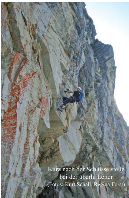
Kurz nach der Schlüsselstelle bei der überh. Leiter