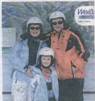
Weißsee Gletscherwelt GmbH

Im Pinzgau reagierte man auf die schweren Pistenunfälle mit einer Gratis-Helm-Aktion.